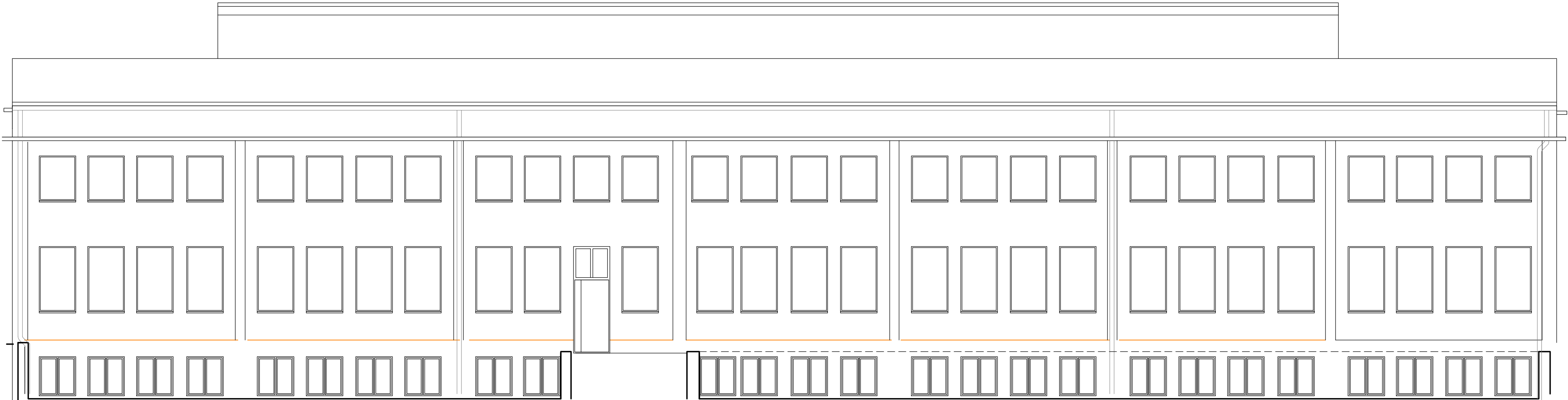
HALA NR 9 - PD